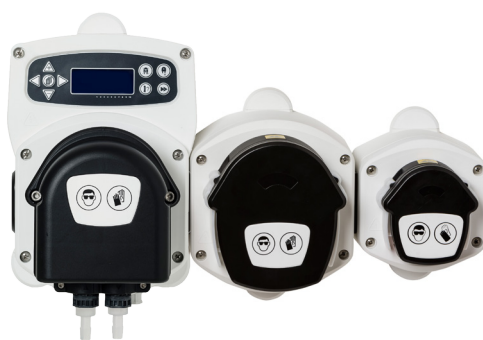
Bomba de membrana BrightLogic

Mantenimiento reducido a la mínima expresión: No hay costes por cambio de tubos.